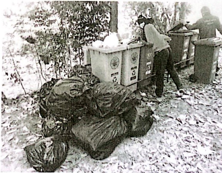
องค์การบริหารส่วนตำบลสระแก้ว