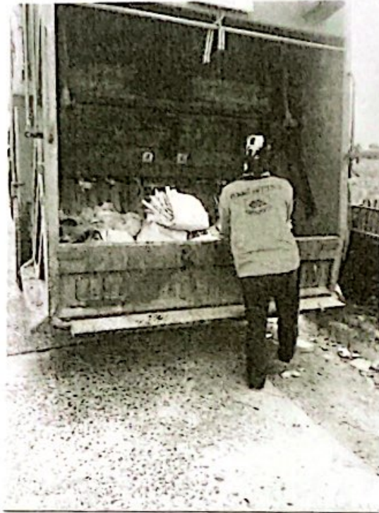
ภาพการจัดการขยะมูลฝอยในพื้นที่