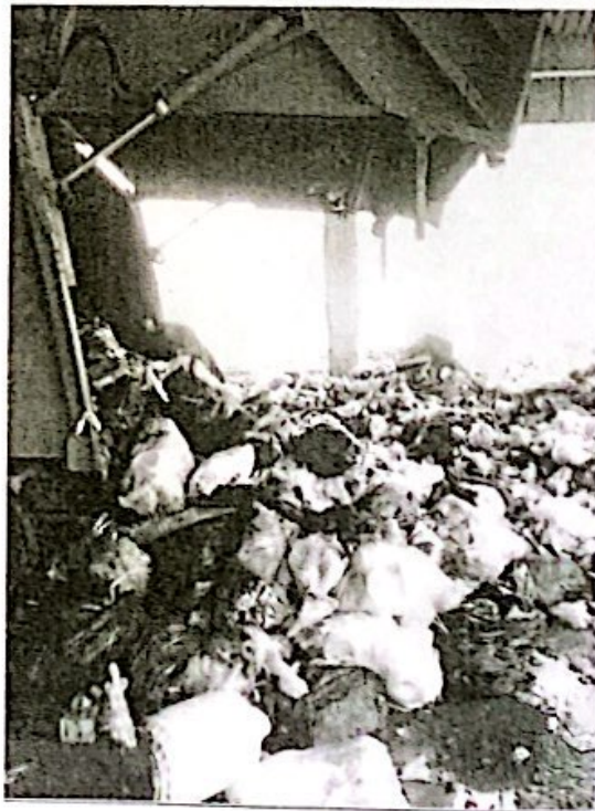
องค์การบริหารส่วนตำบลสระแก้ว