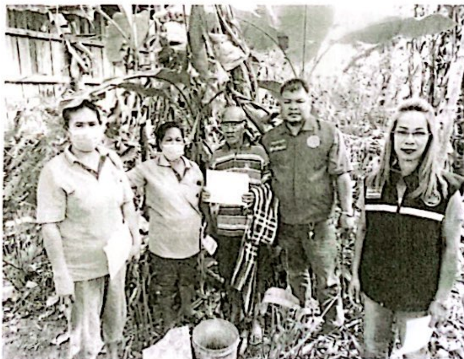
องค์การบริหารส่วนตำบลสระแก้ว