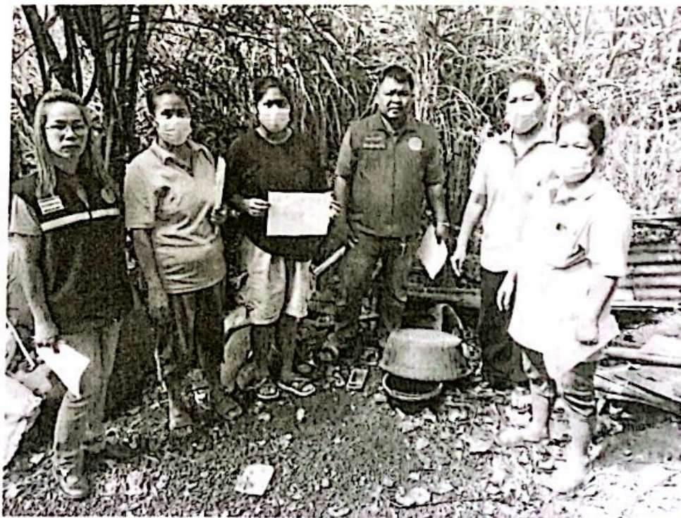
องค์การบริหารส่วนตำบลสระแก้ว