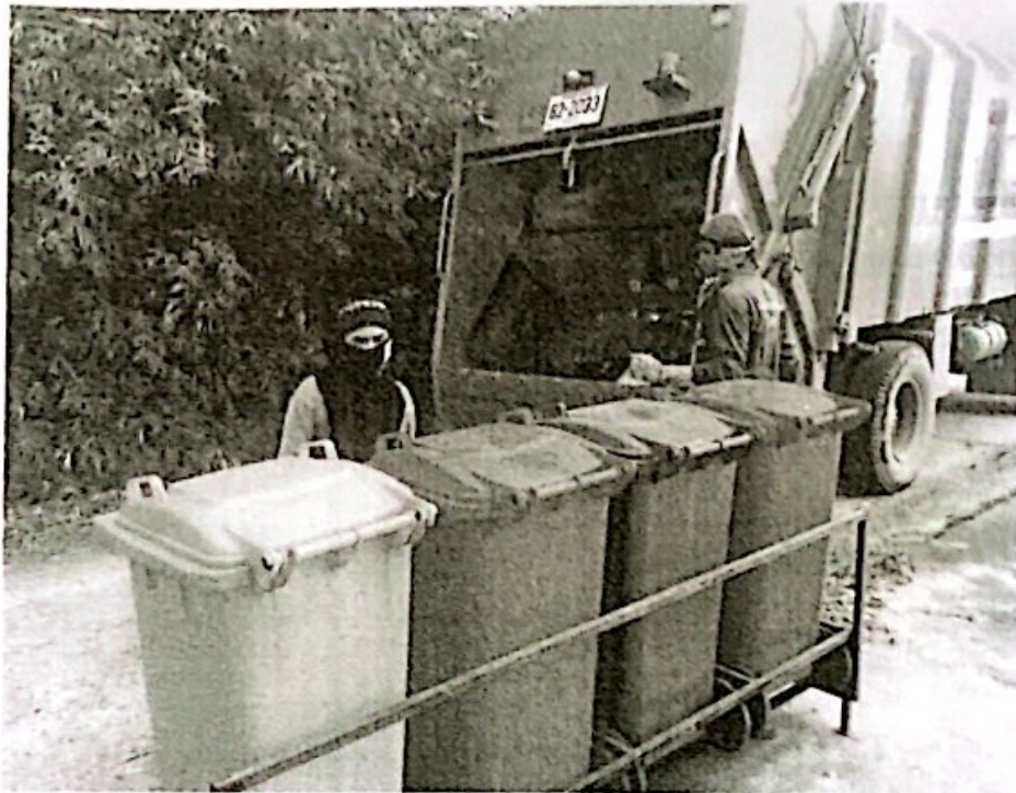
ภาพการคัดแยกขยะมูลฝอยเบื้องต้น