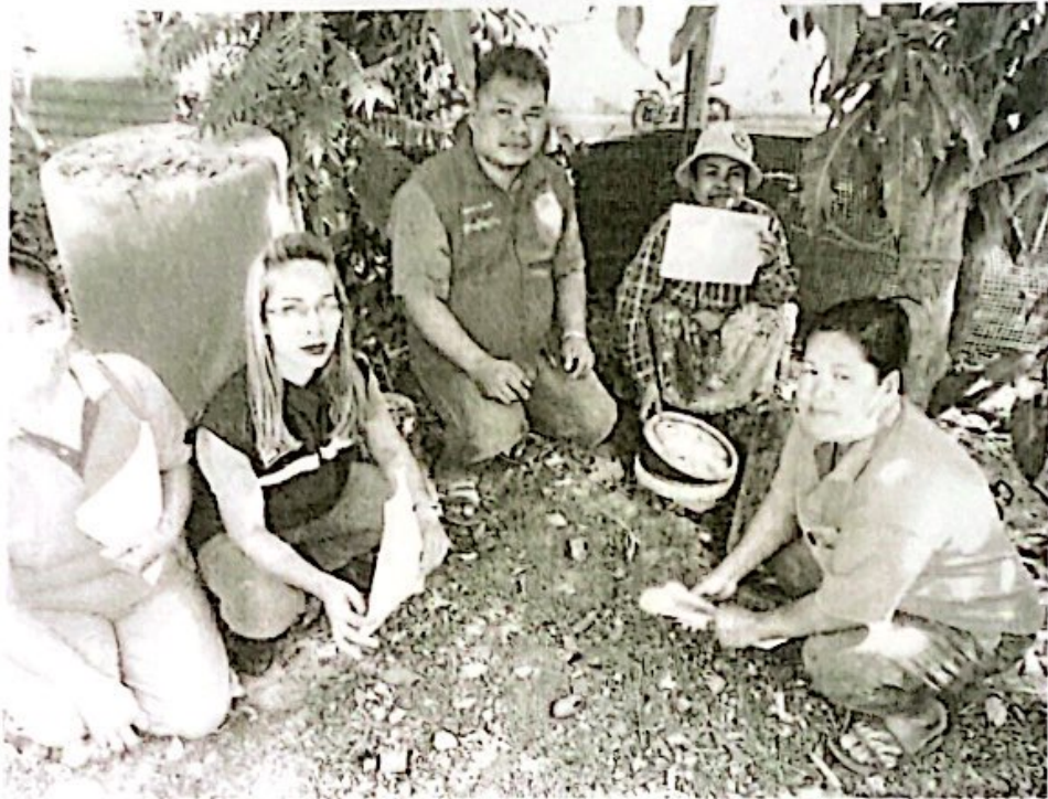
ภาพการสำรวจข้อมูลขยะมูลฝอยระดับครัวเรือน