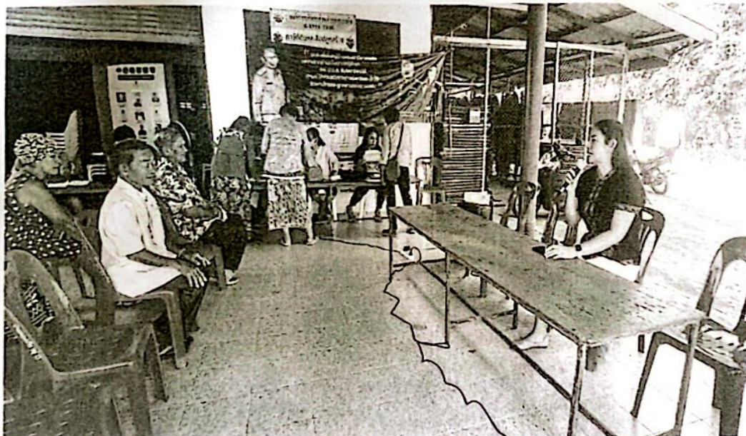
องค์การบริหารส่วนตำบลสระแก้ว