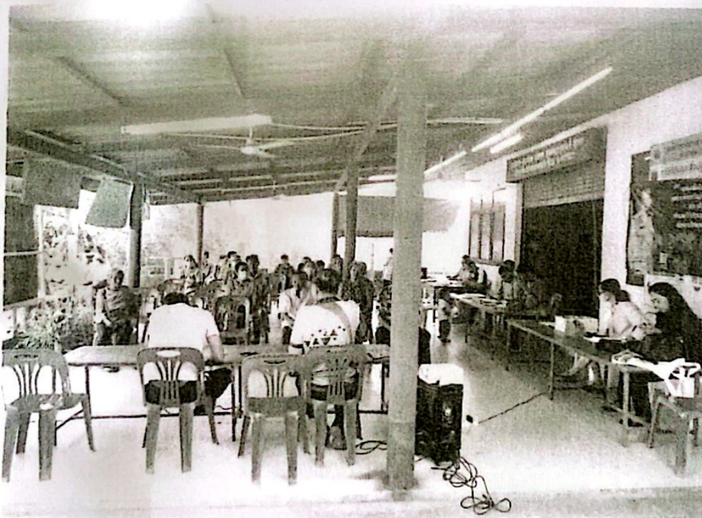
องค์การบริหารส่วนตำบลสระแก้ว