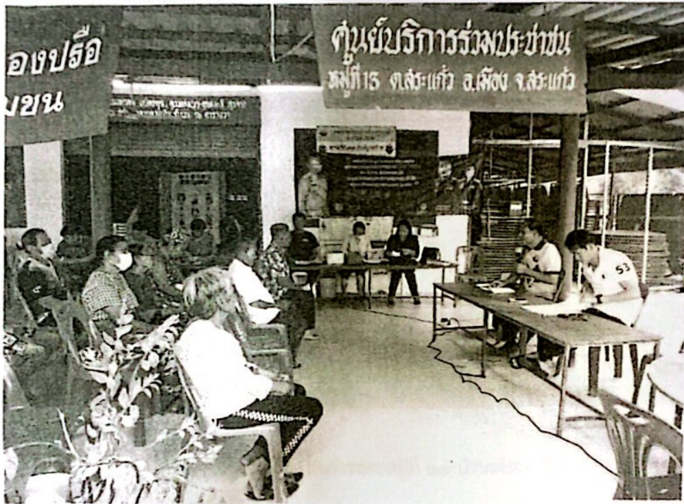
ภาพการประชุมสัมพันธธนาคารขยะหมู่ที่ ๑๓ บ้านหนองปรือ