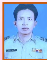
ฝ่ายจัดซื้อ/ฝ่ายขาย