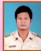
ฝ่ายติดตามและประเมินผล