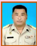
ฝ่ายทะเบียนสมาชิกและบันทึกข้อมูล