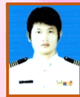
ฝ่ายการเงินและบัญชี