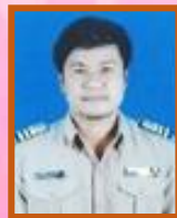
ฝ่ายประชาสัมพันธ์